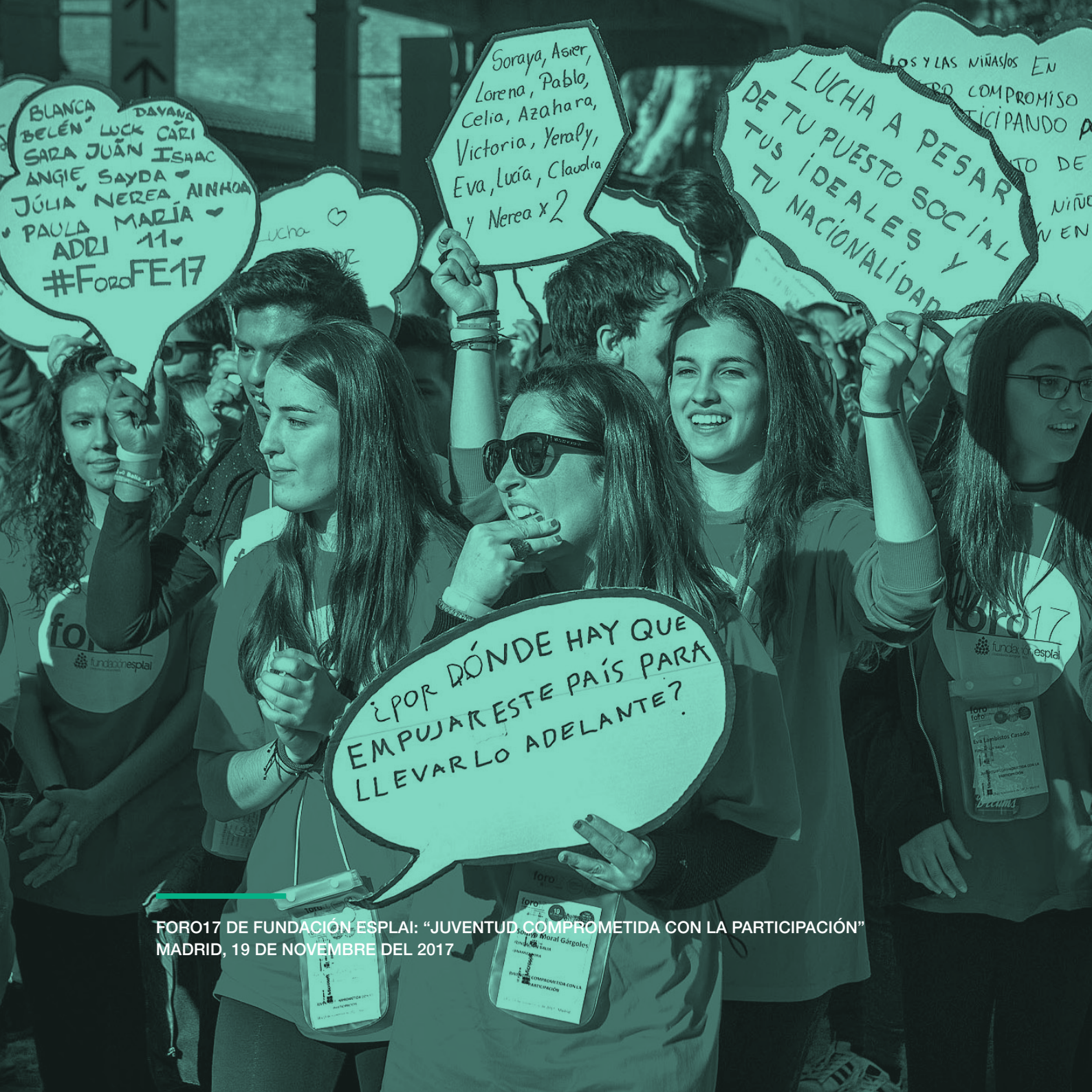
FORO17 DE FUNDACIÓN ESPLAI: "JUVENTUD COMPROMETIDA CON LA PARTICIPACIÓN" MADRID, 19 DE NOVIEMBRE DEL 2017