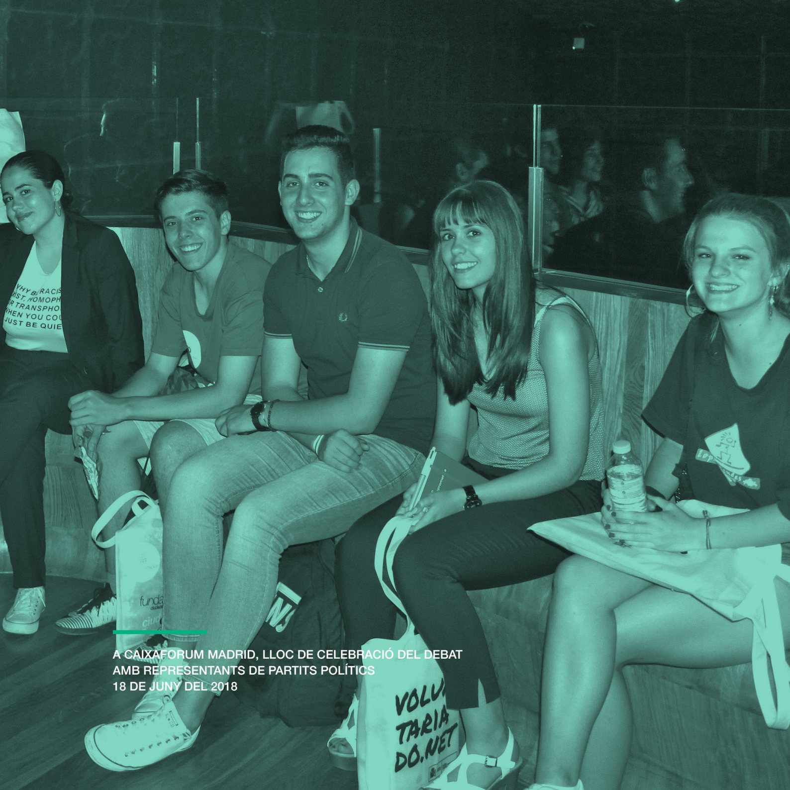
A CAIXAFORUM MADRID, LLOC DE CELEBRACIÓ DEL DEBAT AMB REPRESENTANTS DE PARTITS POLÍTICS 18 DE JUNY DEL 2018