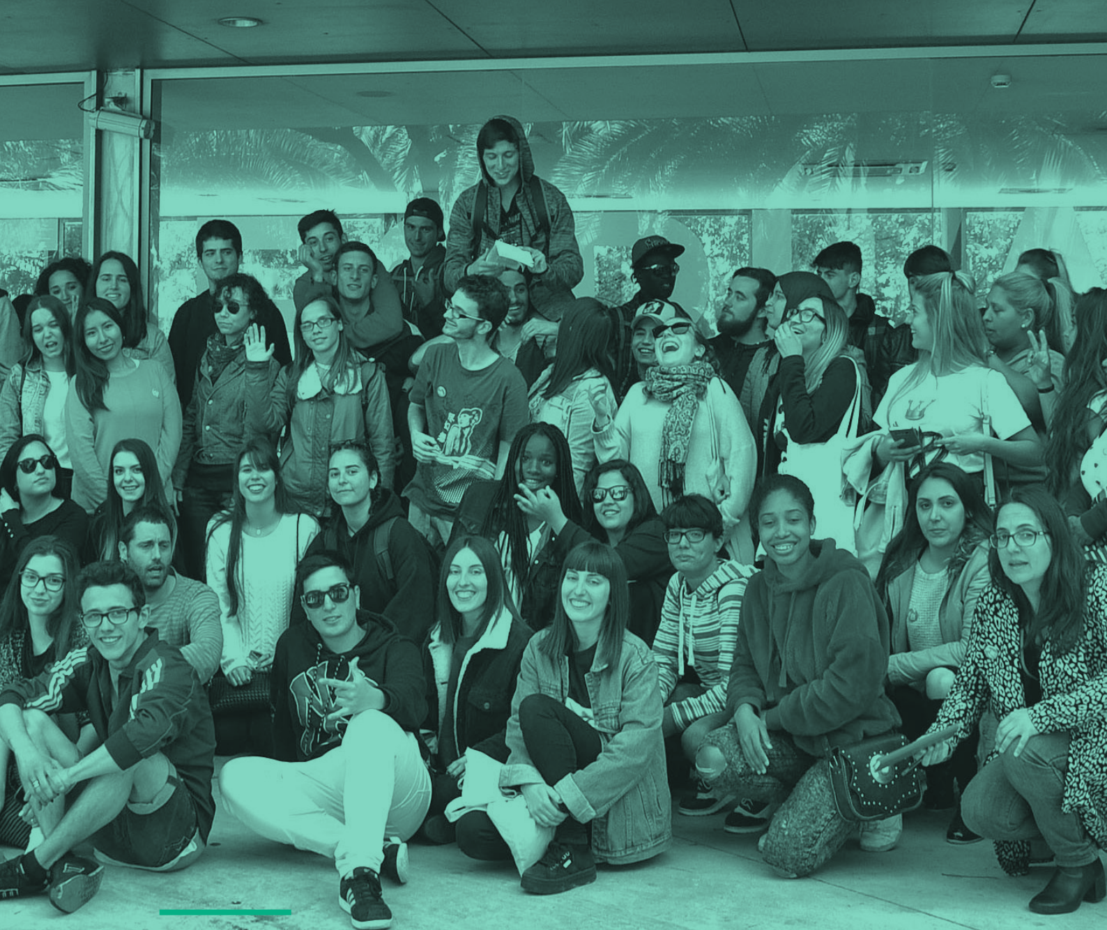
DEBAT PRESENCIAL CELEBRAT A CENTRE ESPLAI EL PRAT DE LLOBREGAT (BARCELONA), 2 DE MAIG DEL 2018