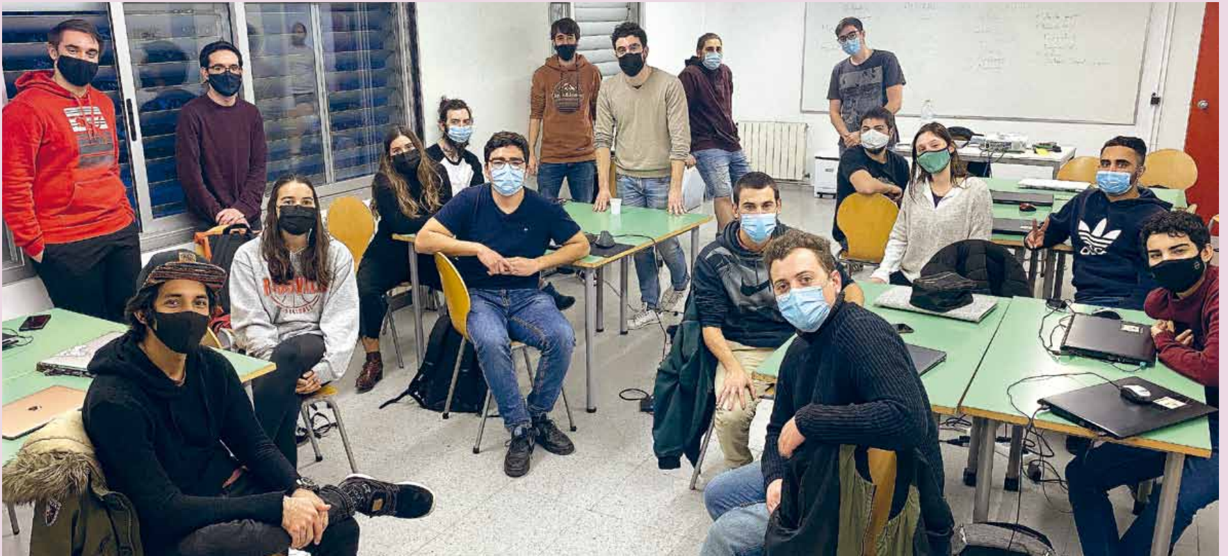
Grupo del programa Enfoca't , empleabilidad juvenil en el sector de las tecnologías.