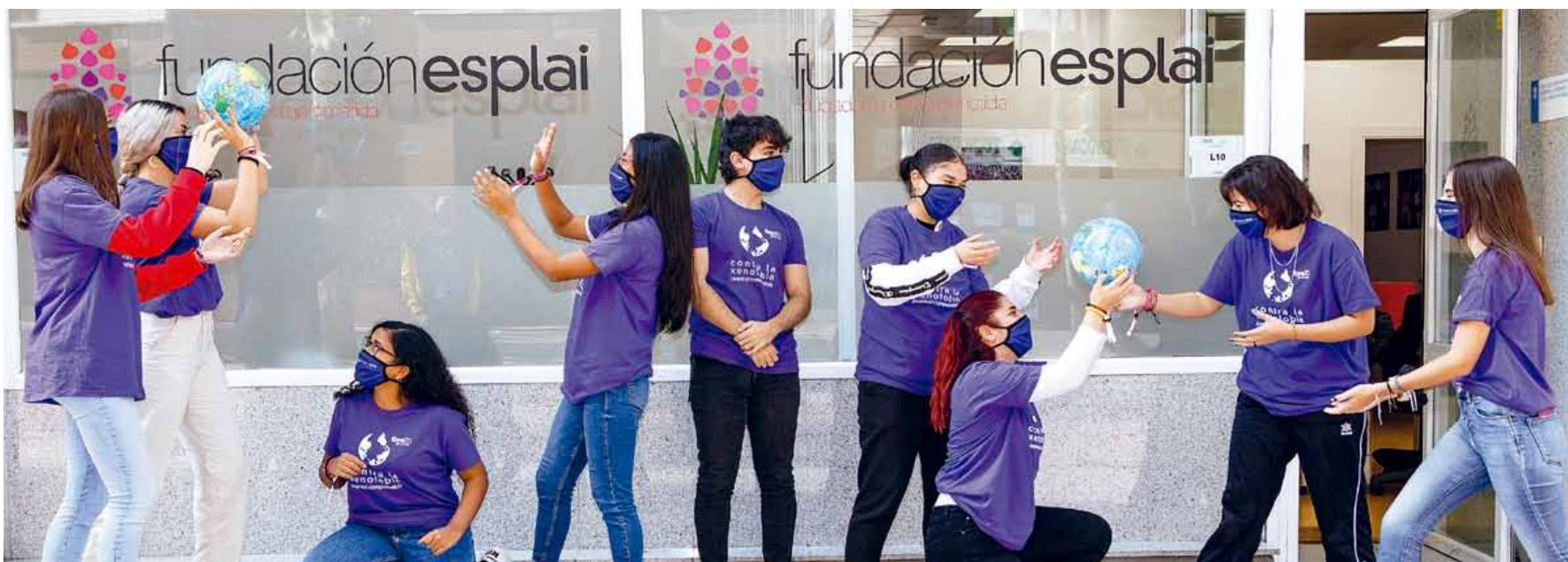
Taller ¡Que no te la cuelen! Aprende a identificar noticias falsas en internet.

PARA COMBATIR LOS PREJUICIOS Y EL DISCURSO DE ODIO