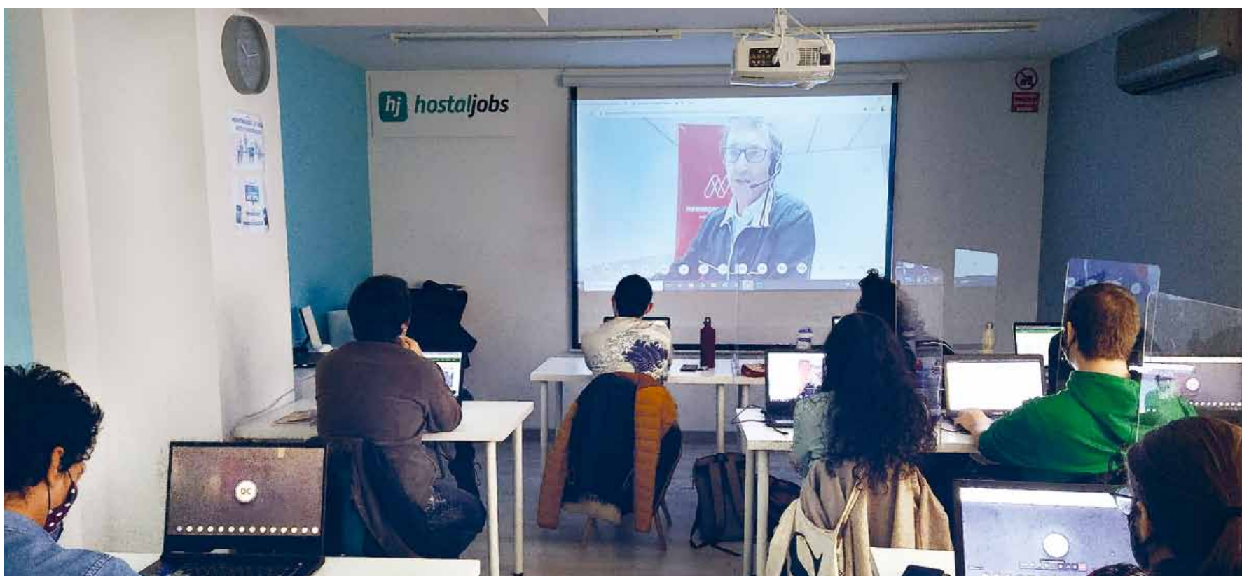
Los cursos para jóvenes programadores/as incorporan formación en valores y otras capacitaciones transversales.