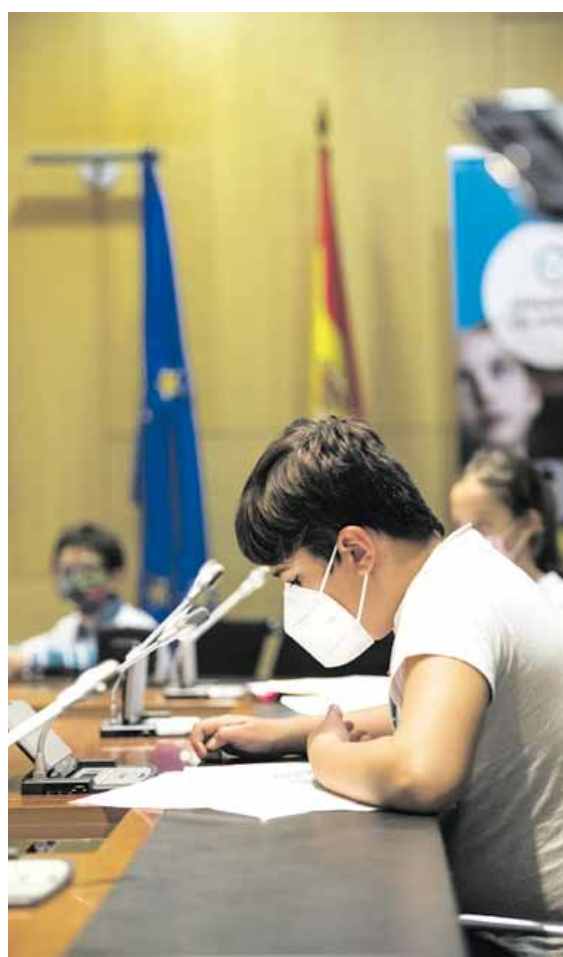
Plataforma de Infancia / Sara Pisaa

Además, contábamos con la tasa de abandono escolar más alta de la OCDE (17,3%) concentrada especialmente en los niños y niñas con una situación socioeconómica más desfavorecida. Dado que estas cifras eran anteriores a la pandemia y al cierre de los centros educativos, ahora corremos un riesgo mucho mayor. Los datos son contundentes: el 44% de las familias de bajos ingresos no tienen un ordenador en casa, hecho que impacta no solo sobre el derecho a la educación sino también sobre el ocio y desarrollo personal de los propios niños y niñas. Por eso pedimos aumentar el gasto público en becas y ayudas al estudio desde el 0,17% del PIB actual al 0,44% del PIB en 2020, incrementando su progresividad, así como medidas para reducir el impacto de la brecha digital . Para muchos niños y niñas la escuela no solo es formación: también es protección frente a la violencia, les garantiza una comida saludable al día y la socialización que requieren en un ambiente saludable. Por ello, habría que prever medidas específicas en la planificación,