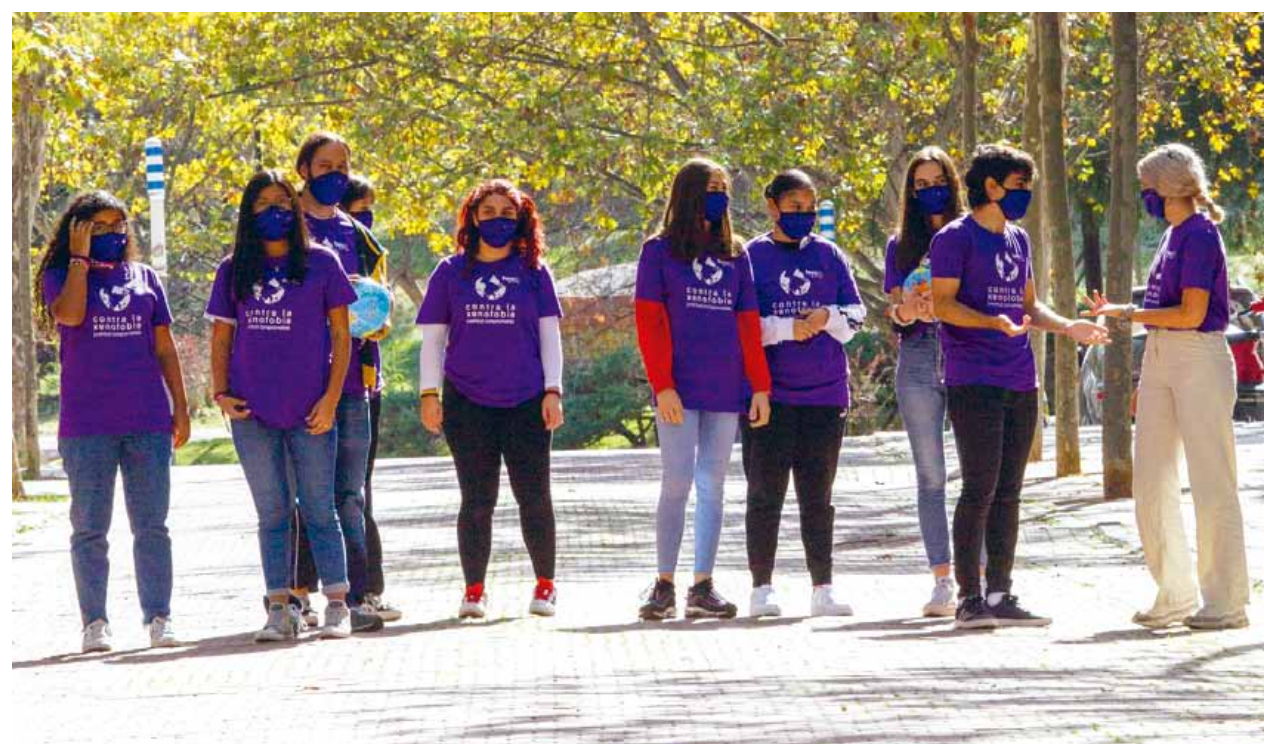
Grupo de jóvenes participantes en los talleres del Foro20 "Sin prejuicios: Juventud comprometida contra la xenofobia".