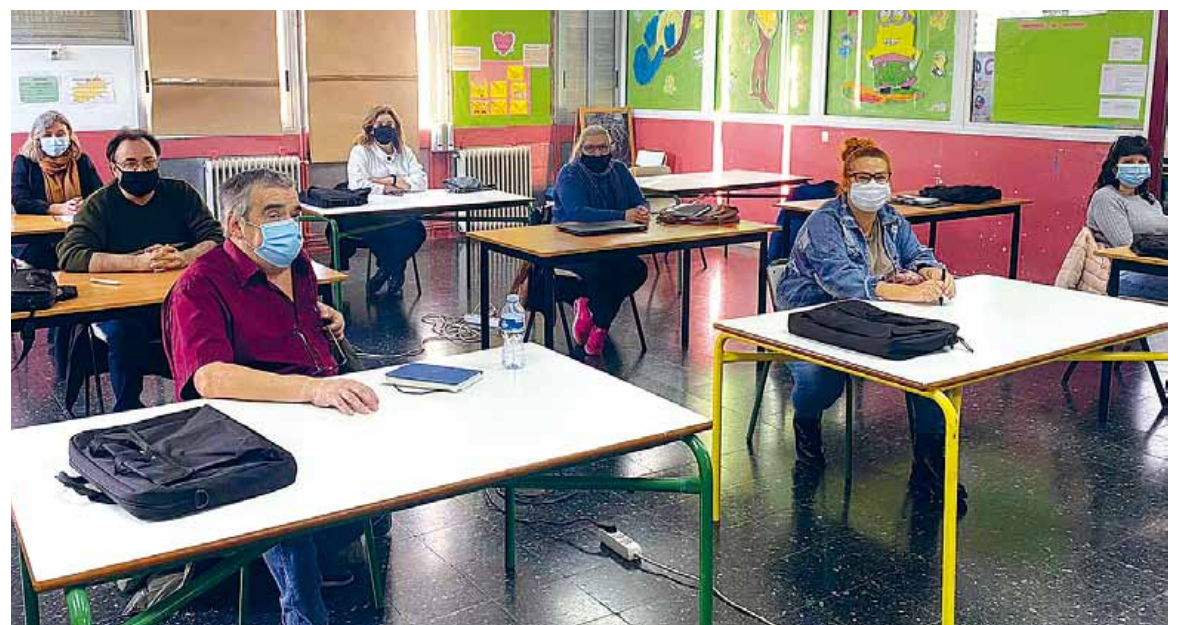
Grupo del programa de formación TIC +45, en El Prat de Llobregat (Barcelona).