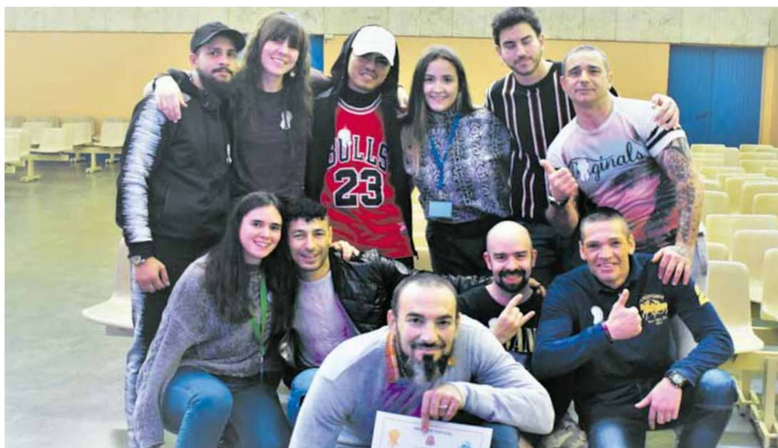
Grupo Re-conéctate, voluntarias e internos, en el CP Madrid III (Valdemoro), antes de la pandemia del Covid-19.

OFRECEMOS ACCIONES Y RECURSOS PARA QUIENES HABITAN LA CÁRCEL Y PARA SUS FAMILIAS