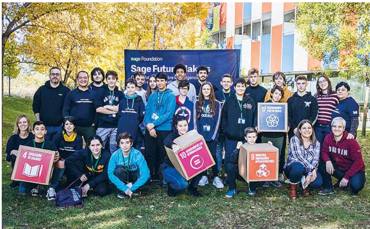
..... Uno de los grupos participantes en el proyecto 'Sage Future Makers', en la sede de El Prat de Llobregat