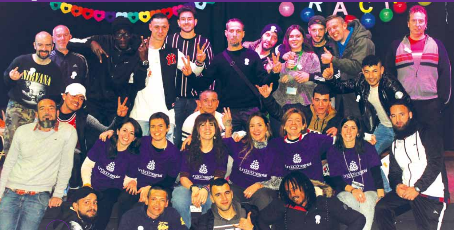
..... Acto de cierre del programa Reconéctate edición 2019