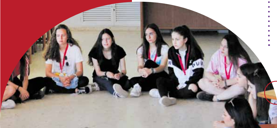
Foro 19 Meeting of young people, Miraflores de la Sierra, May 2019