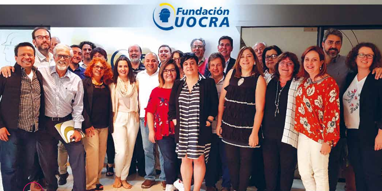
..... Participantes en el XII Encuentro Cívico Iberoamericano celebrado en Costa Rica en octubre de 2018