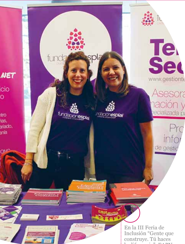
En la III Feria de Inclusión “Gente que construye. Tú haces la diferencia”, EAPN Madrid, octubre 2019