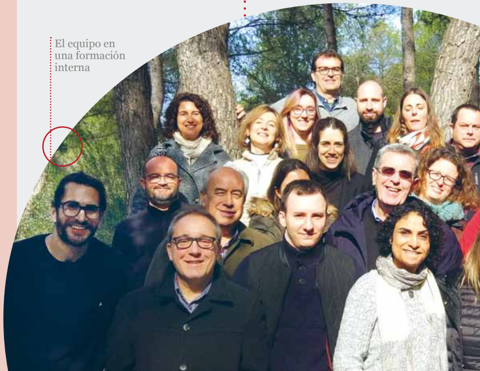
El equipo en una formación interna

○ Felicidad: Queremos promover la formación de personas que aspiren a una vida digna y plena, que se fundamente en la autoconfianza y la apertura hacia las otras personas, en los afectos compartidos, en la honestidad, la generosidad, la expresión de los sentimientos y el compromiso con la comunidad.