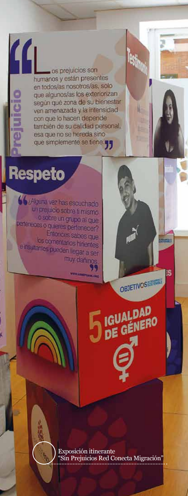
Exposición itinerante "Sin Prejuicios Red Conecta Migración"