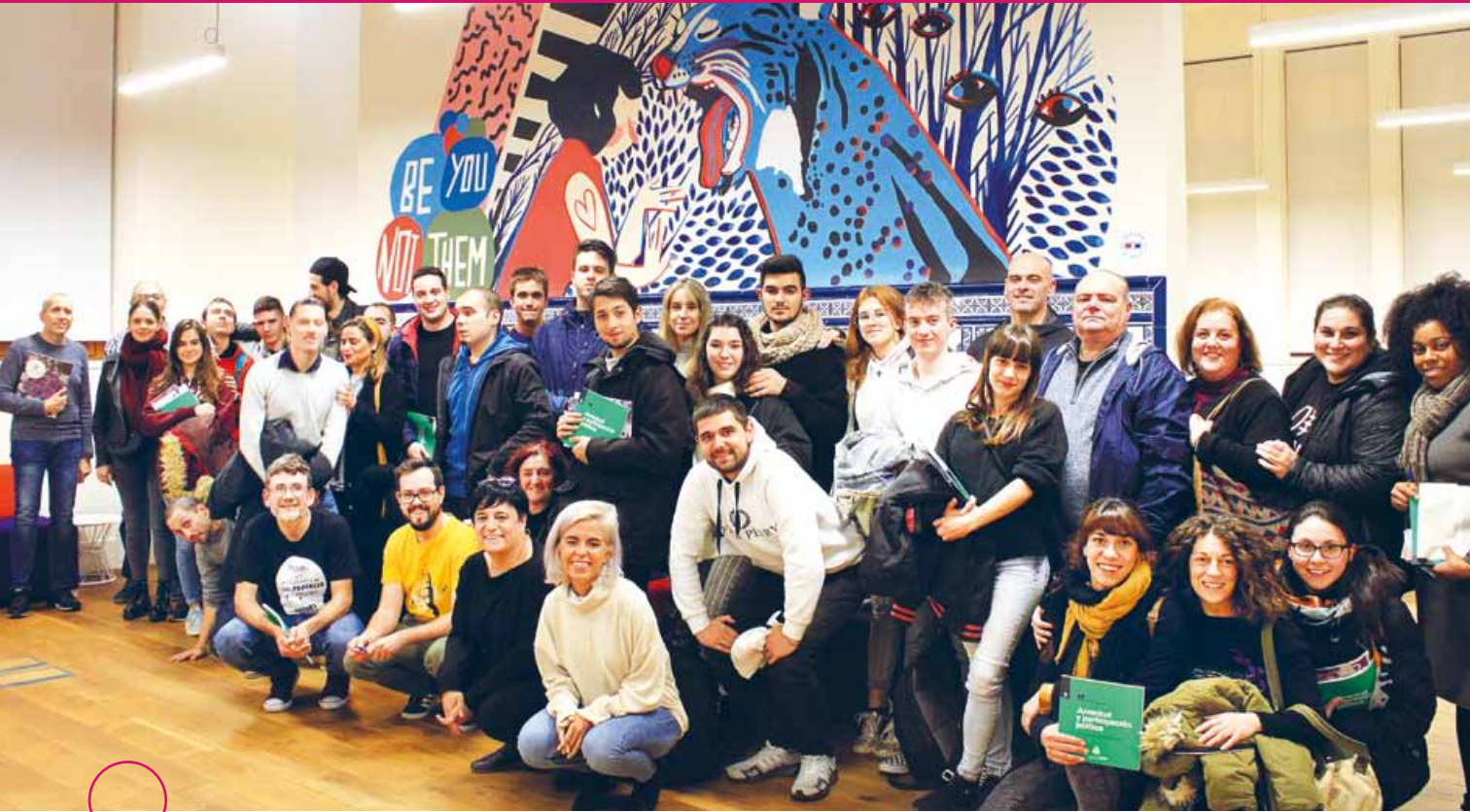
Presentación de Juventud y participación política en la Oficina de la Juventud de Gijón