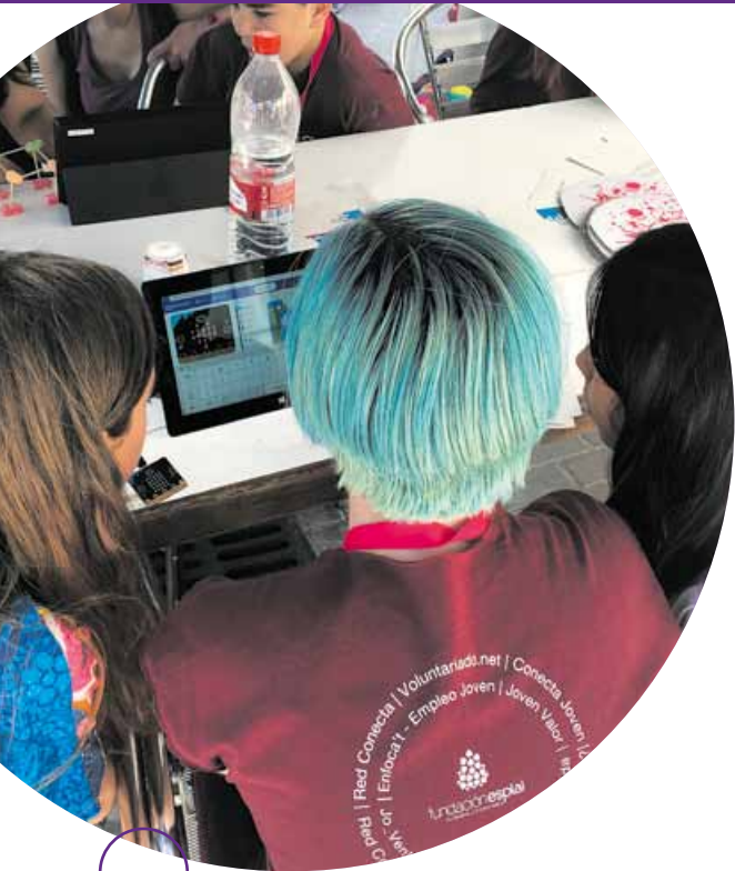
Actividad de programación en el Foro de Fundación Esplai