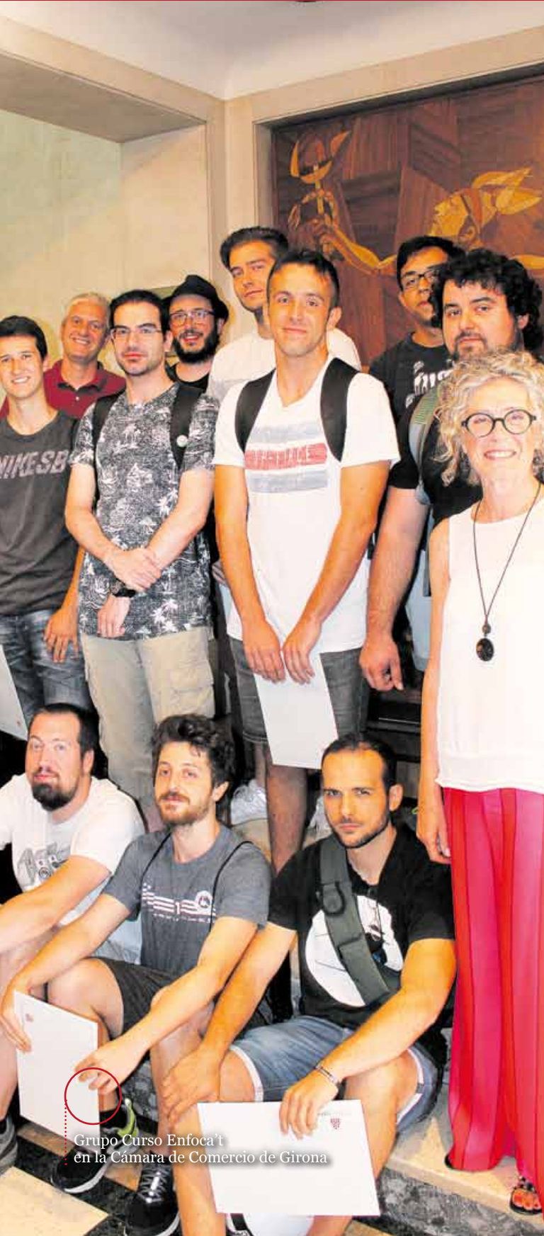
Grupo Curso Enfoca t en la Cámara de Comercio de Girona