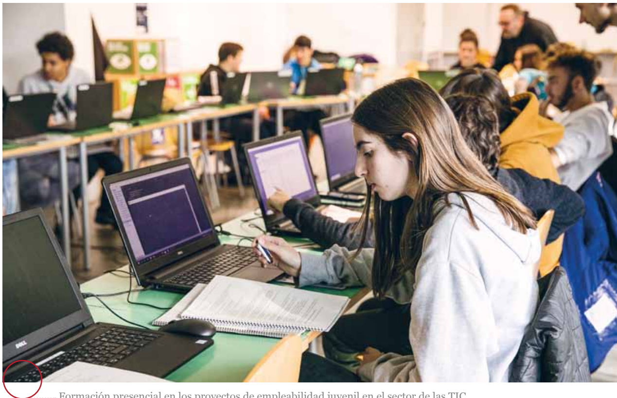
Formación presencial en los proyectos de empleabilidad juvenil en el sector de las TIC