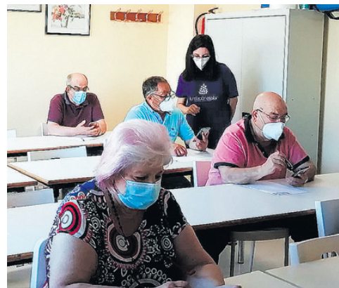
Programa “TIC para el bienestar de las personas mayores”, taller en ATEGAL, Galicia.