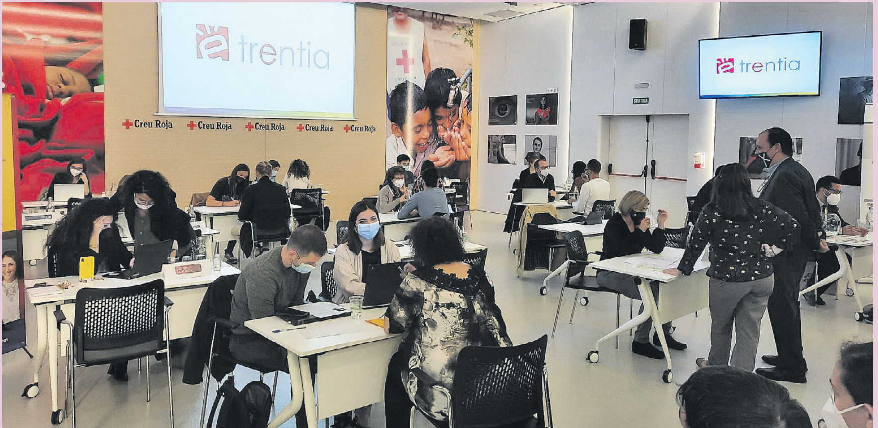
Speed dating celebrado el día de la presentación pública del proyecto BCN Inclusive Coding.