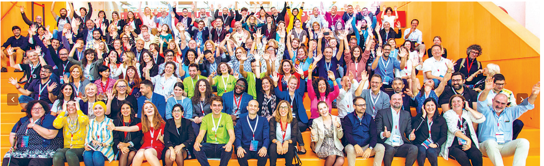
Participantes en la Cumbre anual de ALL DIGITAL, en octubre de 2019.