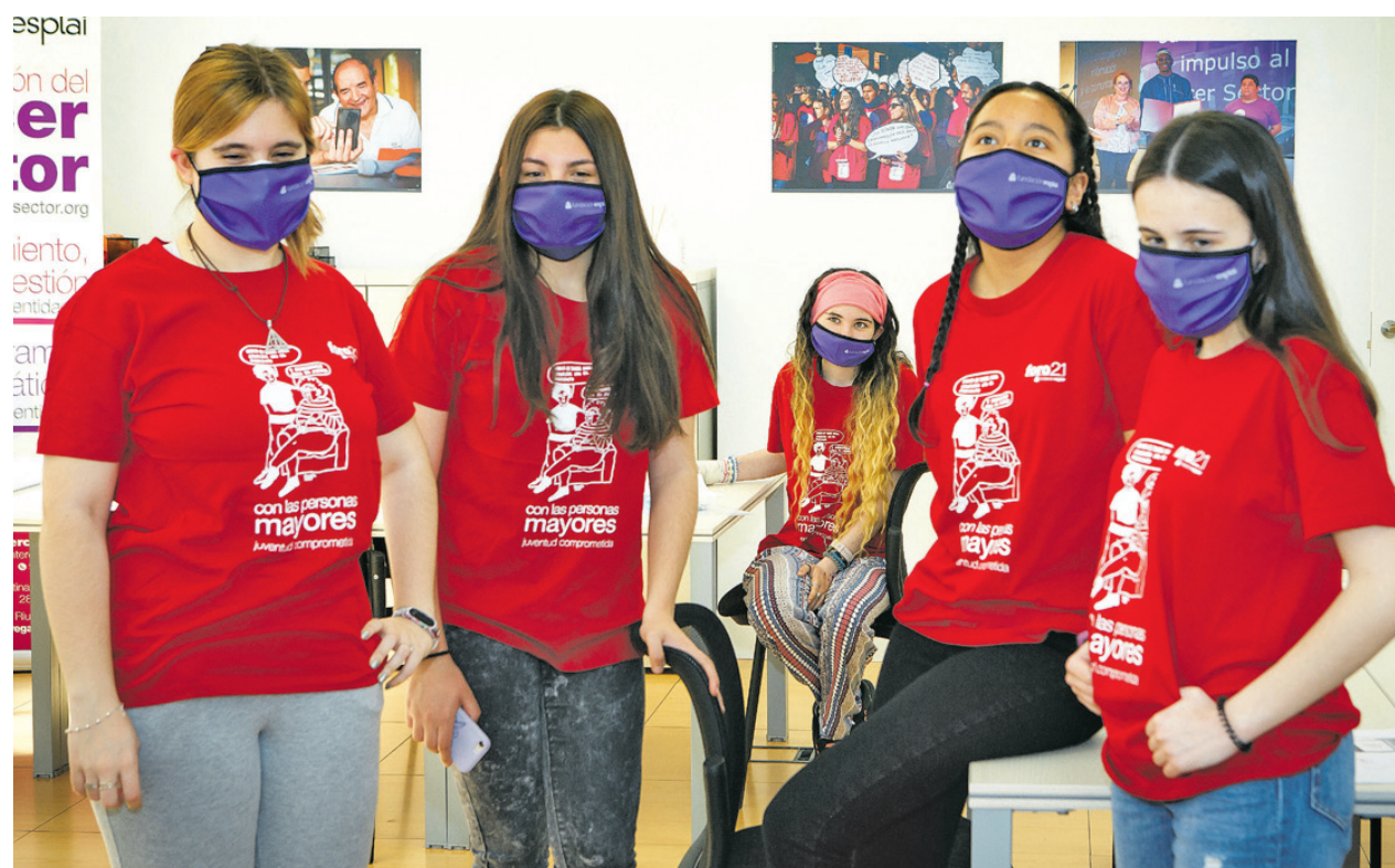
Grupo de jóvenes participantes en los talleres del Foro21 “Juventud comprometida con las personas mayores”.