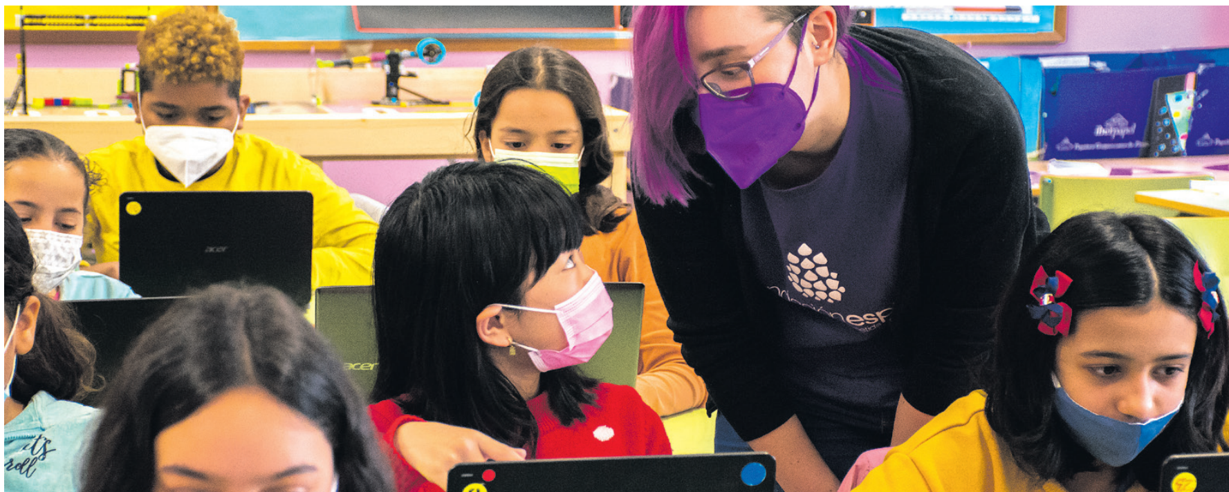
Con el proyecto #ChicasIntech desarrollamos talleres en centros educativos y en entidades sociales.

Desde Fundación Esplai hemos asumido el reto de contribuir a la reducción de la brecha de género desde nuestro trabajo con jóvenes. Para lograrlo, desarrollamos el proyecto #ChicasIntech, que enmarca diferentes acciones para contribuir al empoderamiento de las niñas y jóvenes promoviendo las vocaciones científicas y tecnológicas.