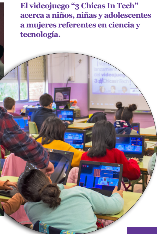
El videojuego “3 Chicas In Tech” acerca a niños, niñas y adolescentes a mujeres referentes en ciencia y tecnología.