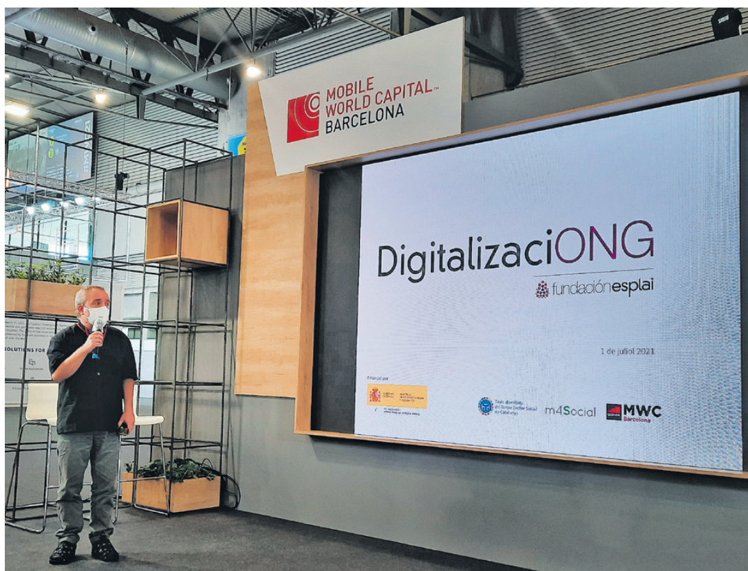
Presentación del proyecto DigitalizaciONG en el Mobile Word Congress del 2021.

ACOMPañAMOS A LAS ENTIDADES SOCIALES EN EL CAMINO DE LA TRANSFORMACIÓN DIGITAL