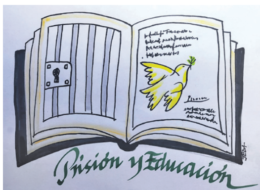
Ilustración de Jesús Damián Fernández Solís para el proyecto de la Escuela Penitenciaria.

Pareja y Familia: por ser los suelos naturales fundamentales sobre los que empezar a reconstruirse como personas libres, y por estar a menudo resentidos, enrarecidos, cambiados tras la estancia en prisión del que ahora retorna. El reencuentro entre quien regresa al núcleo familiar y quienes le