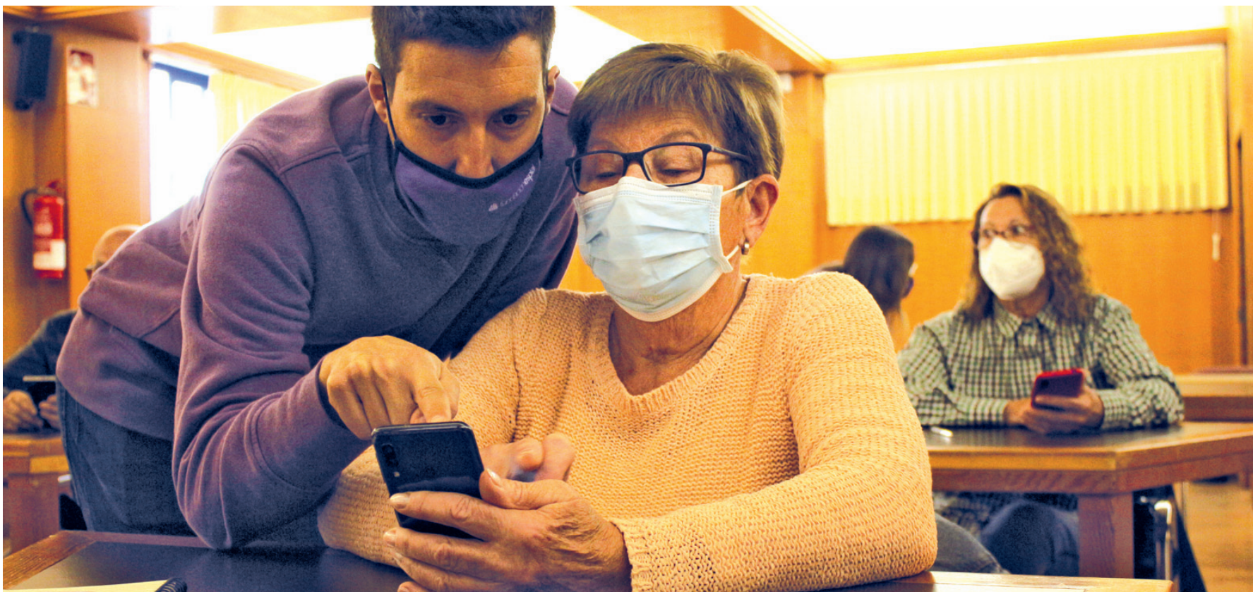
Los talleres para el uso de dispositivos móviles y aplicaciones de uso cotidiano cuentan con atención personalizada.