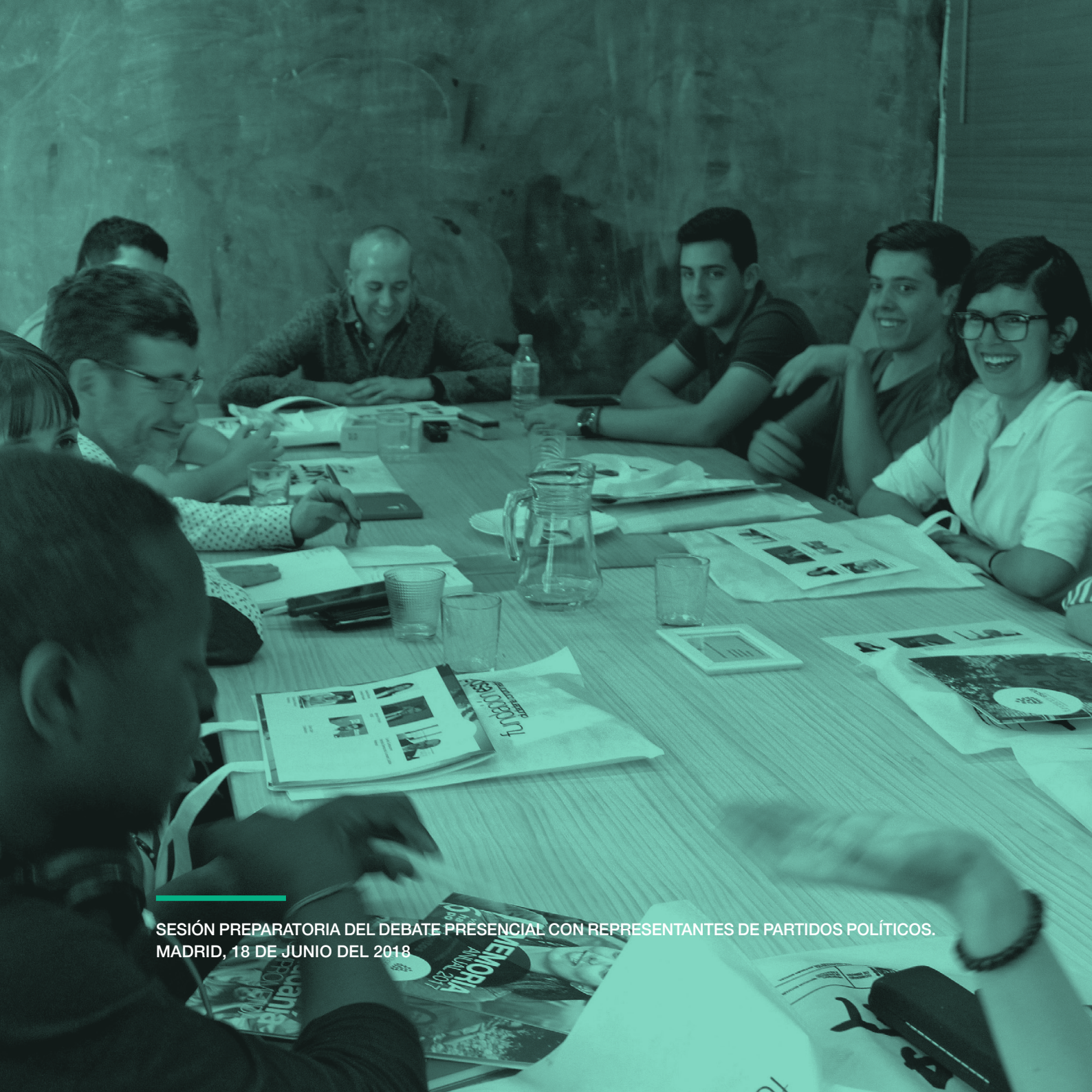
SESIÓN PREPARATORIA DEL DEBATE PRESENCIAL CON REPRESENTANTES DE PARTIDOS POLÍTICOS. MADRID, 18 DE JUNIO DEL 2018