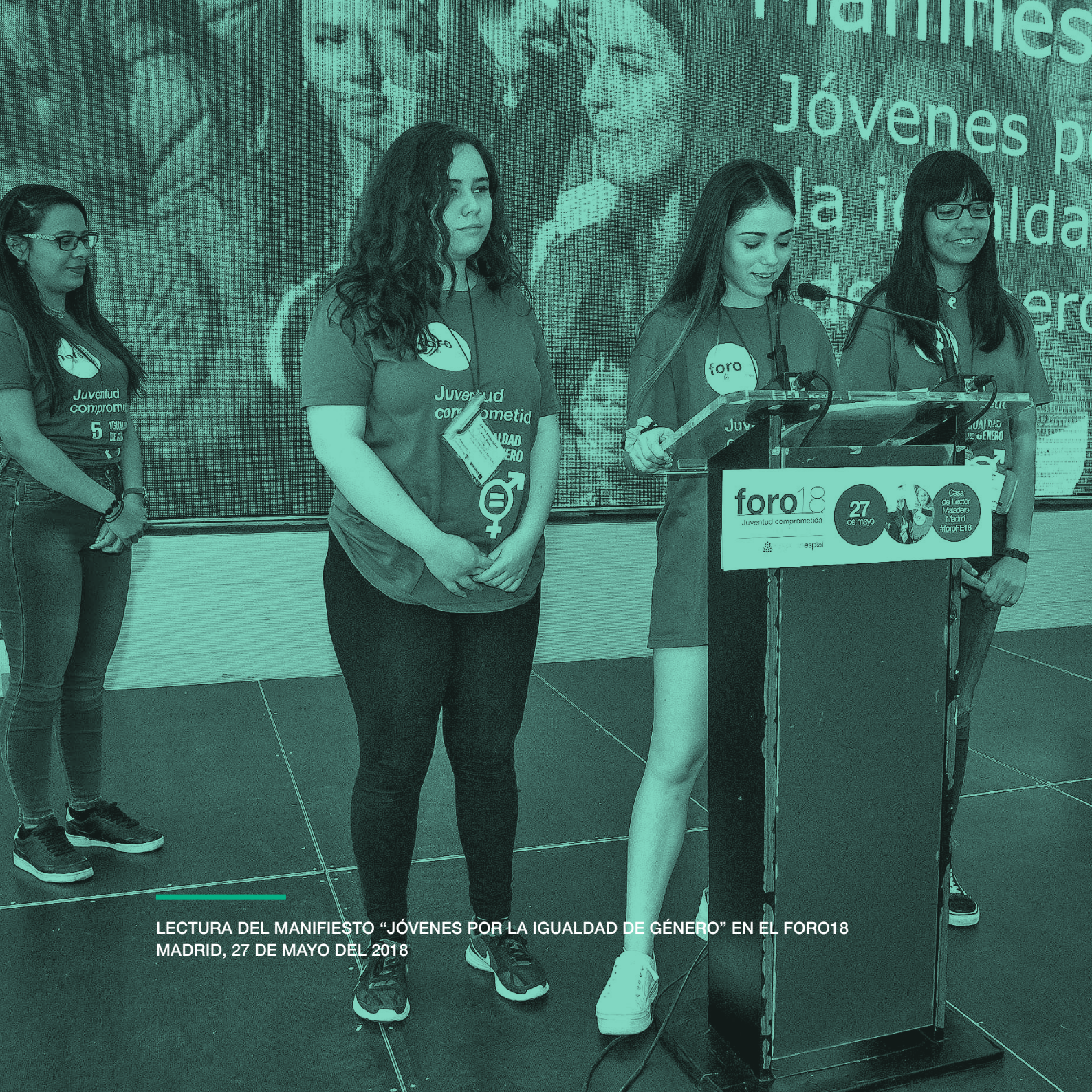
LECTURA DEL MANIFIESTO "JÓVENES POR LA IGUALDAD DE GÉNERO" EN EL FORO18 MADRID, 27 DE MAYO DEL 2018