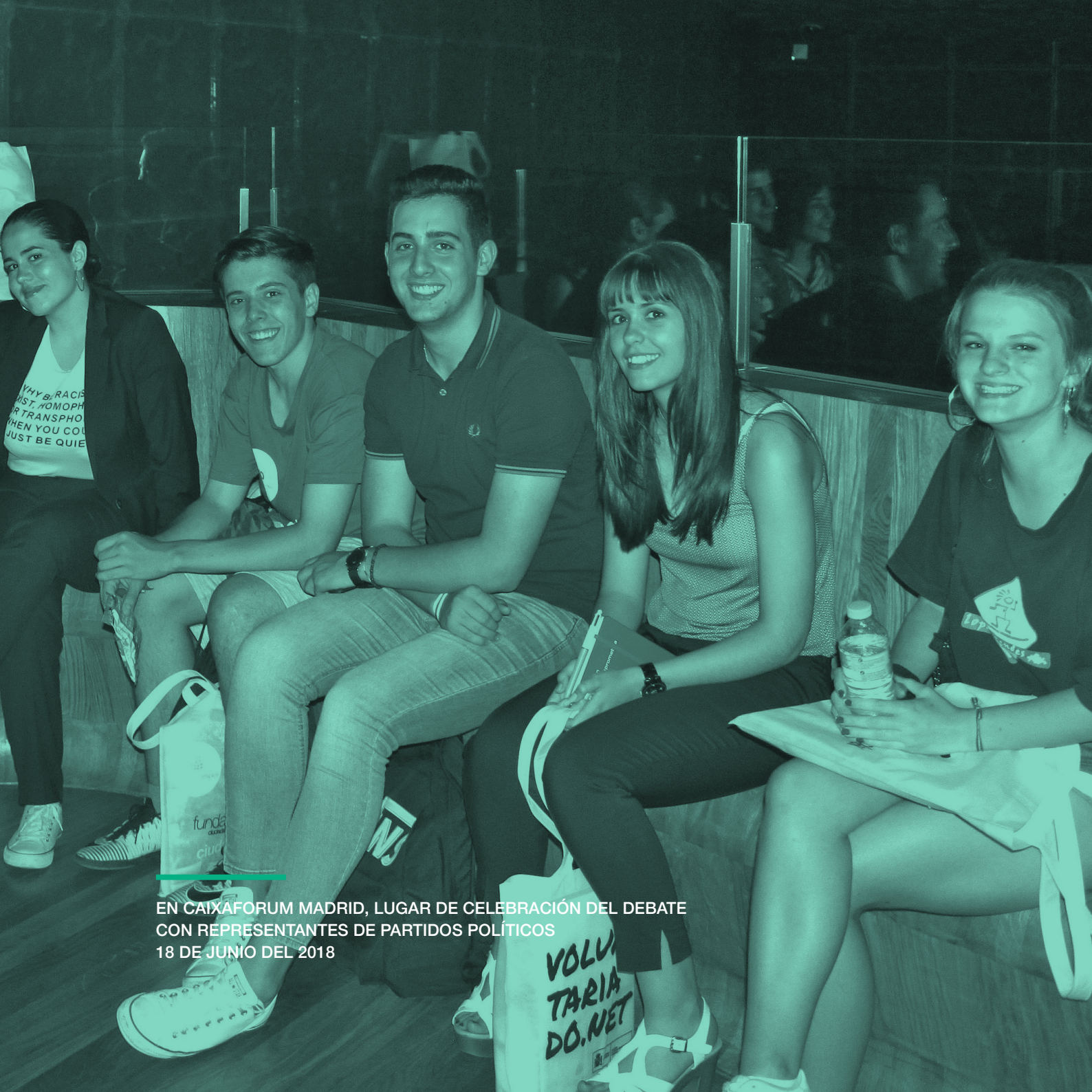
EN CAIXAFORUM MADRID, LUGAR DE CELEBRACIÓN DEL DEBATE CON REPRESENTANTES DE PARTIDOS POLÍTICOS 18 DE JUNIO DEL 2018