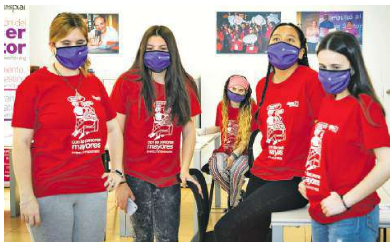
Grupo de jóvenes participantes en los talleres del Foro21 “Juventud comprometida con las personas mayores”.