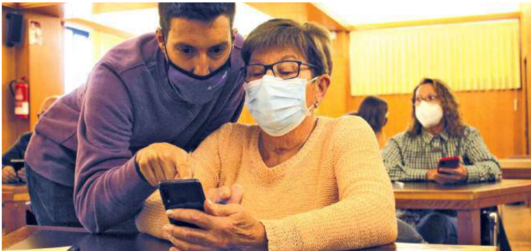
Los talleres para el uso de dispositivos móviles y aplicaciones de uso cotidiano cuentan con atención personalizada.