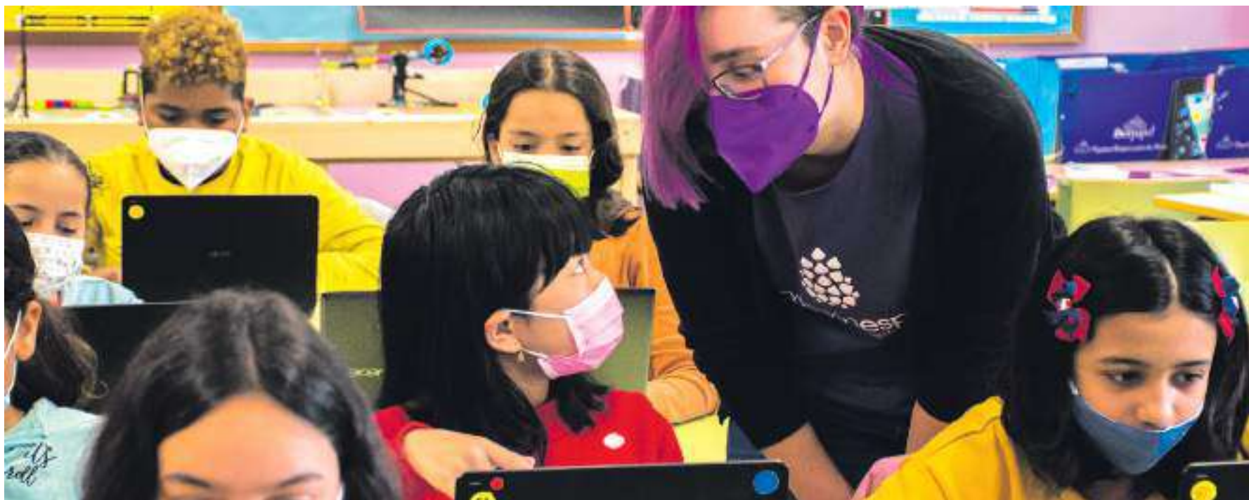
Con el proyecto #ChicasIntech desarrollamos talleres en centros educativos y en entidades sociales.

Desde Fundación Esplai hemos asumido el reto de contribuir a la reducción de la brecha de género desde nuestro trabajo con jóvenes. Para lograrlo, desarrollamos el proyecto #ChicasIntech, que enmarca diferentes acciones para contribuir al empoderamiento de las niñas y jóvenes promoviendo las vocaciones científicas y tecnológicas.