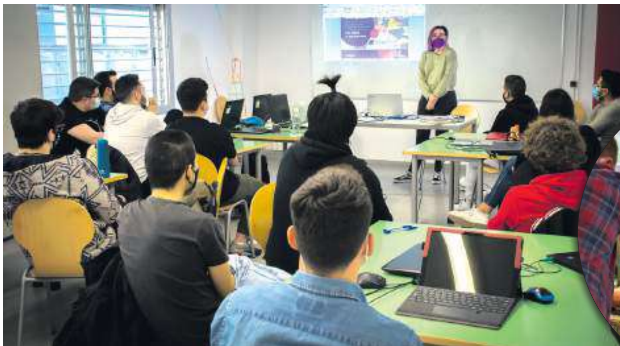
El videojuego “3 Chicas In Tech” acerca a niños, niñas y adolescentes a mujeres referentes en ciencia y tecnología.

Para mí la tecnología es una fuente de información con la que también te puedes divertir. Nos permite hacer prácticamente de todo, se usa en casi todas las profesiones, menos en algunas que son tradicionales. Creo que la tecnología interesa por igual a chicos y a chicas, porque a mí por ejemplo me encanta. Una de mis referentes es Hedy Lamarr, porque inventó el wifi.