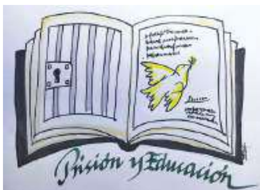
Ilustración de Jesús Damián Fernández Solís para el proyecto de la Escuela Penitenciaria.

Pareja y Familia: por ser los suelos naturales fundamentales sobre los que empezar a reconstruirse como personas libres, y por estar a menudo resentidos, enrarecidos, cambiados tras la estancia en prisión del que ahora retorna. El reencuentro entre quien regresa al núcleo familiar y quienes le