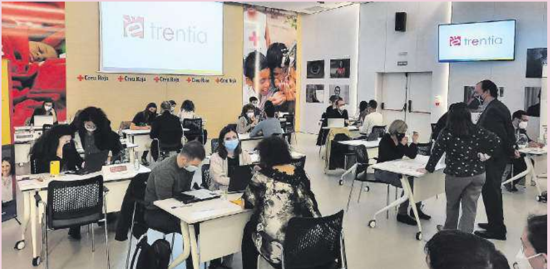
Speed dating celebrado el día de la presentación pública del proyecto BCN Inclusive Coding.