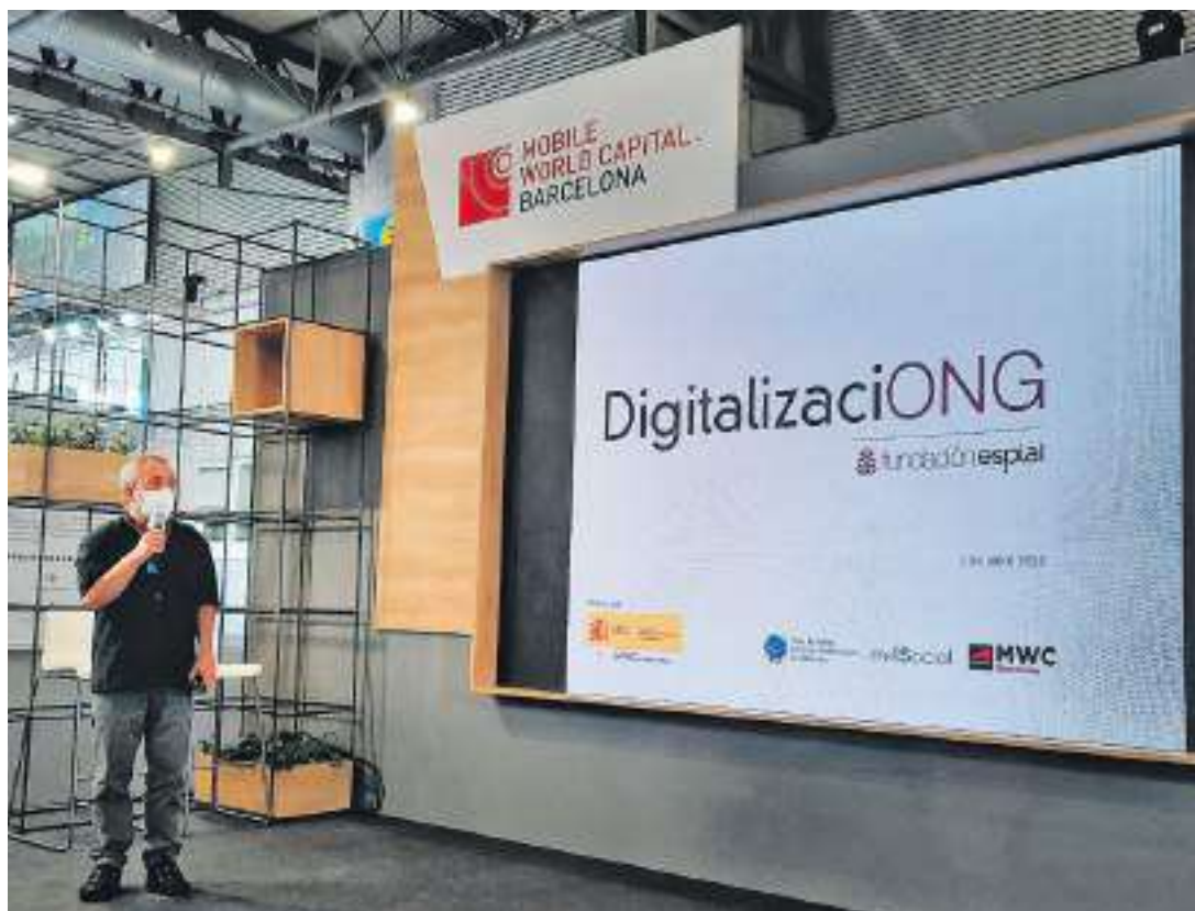
Presentación del proyecto DigitalizaciONG en el Mobile Word Congress del 2021.

ACOMPañAMOS A LAS ENTIDADES SOCIALES EN EL CAMINO DE LA TRANSFORMACIÓN DIGITAL