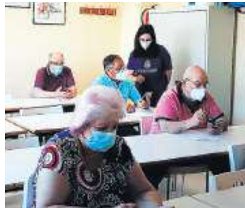
Programa “TIC para el bienestar de las personas mayores”, taller en ATEGAL, Galicia.