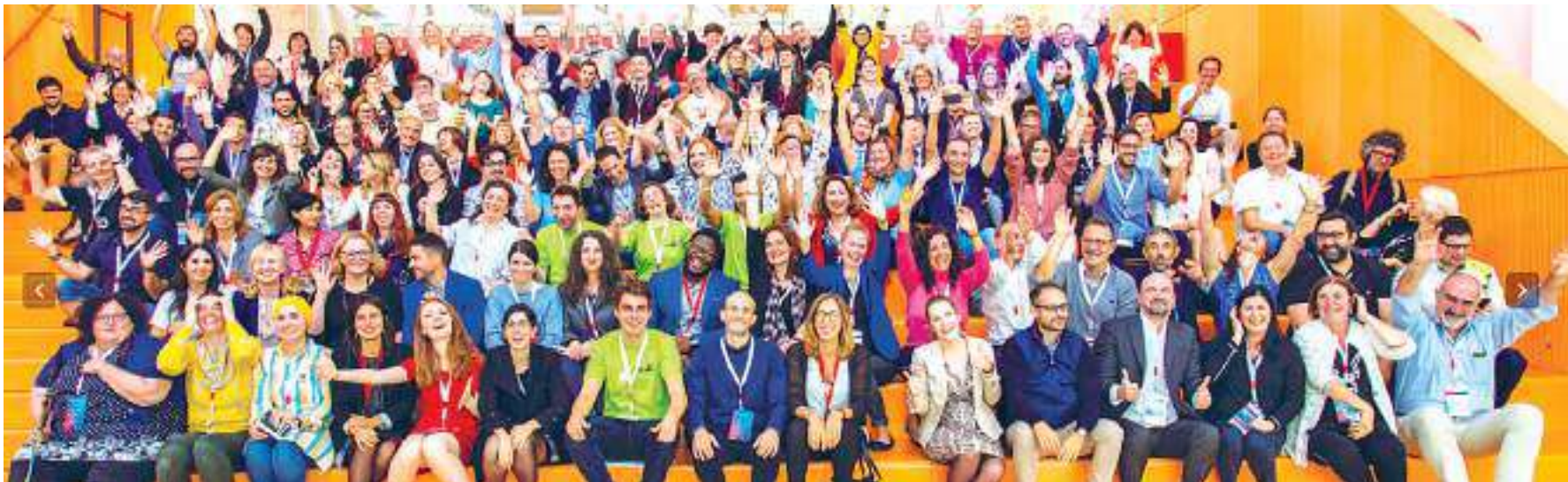
Participantes en la Cumbre anual de ALL DIGITAL, en octubre de 2019.