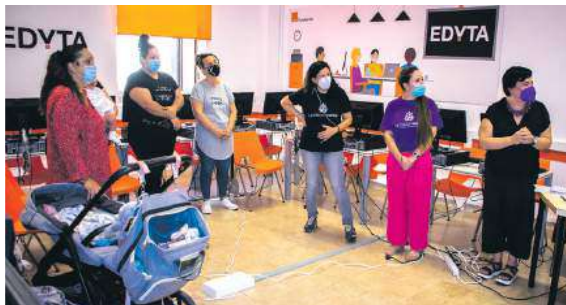
En la inauguración del aula Edyta Fundación Esplai en Tarragona.