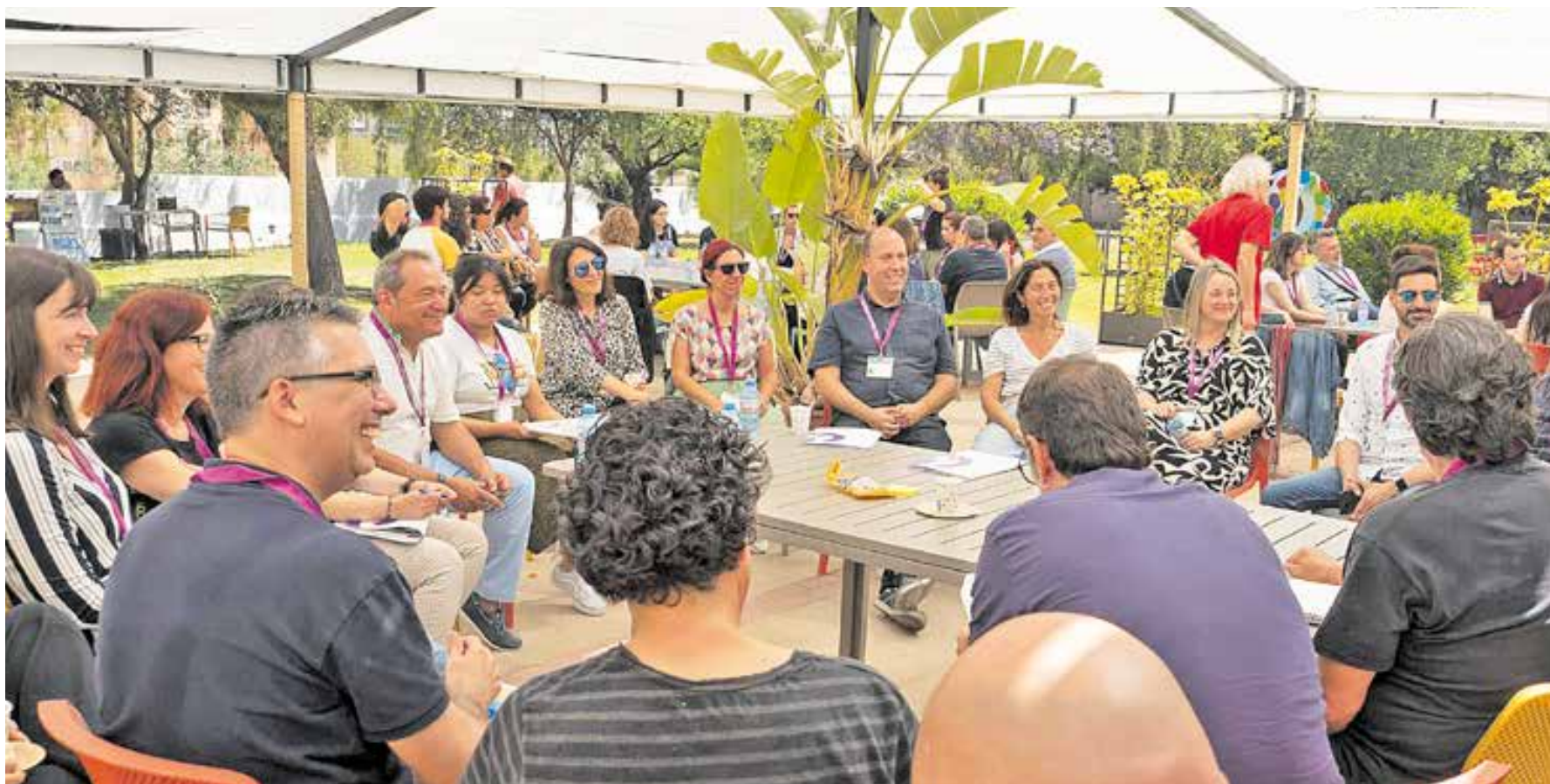
Presentación de resultados del Observatorio de Brechas Digitales con entidades de la Plataforma Red Conecta.