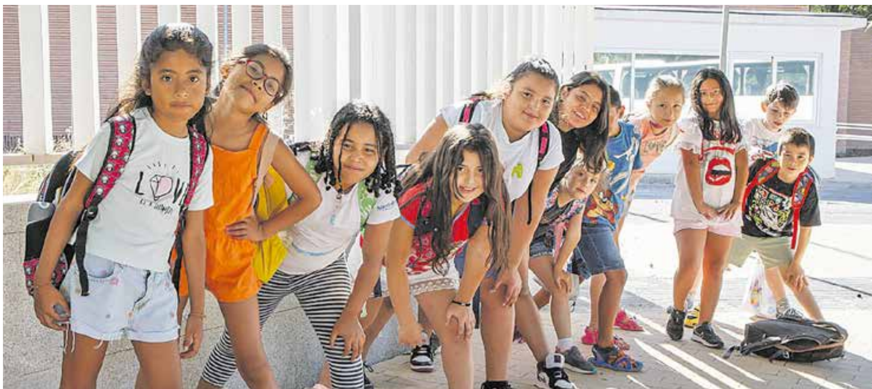
Campamento urbano Joven In Tech en el barrio de Latina, Madrid.

El código postal del lugar donde se vive determina las oportunidades a las que se tiene acceso y sitúa círculos de vulnerabilidad que estructuran la pobreza en determinados barrios y ante las que es fundamental y determinante actuar para crear en su lugar círculos virtuosos.