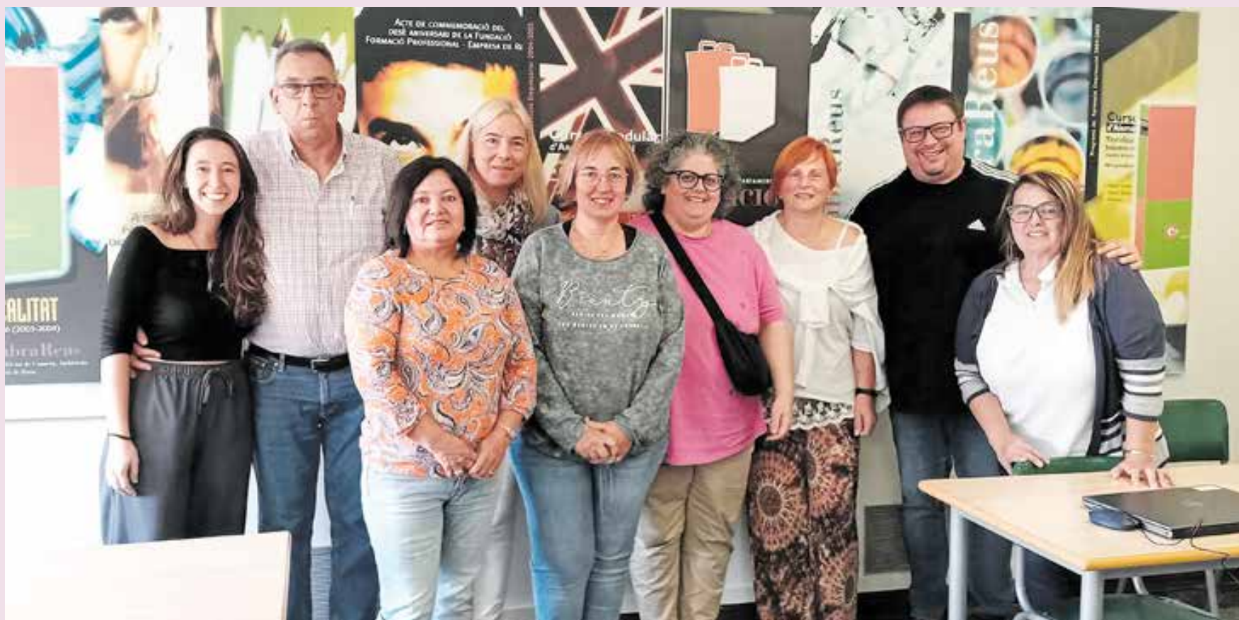
Grupo de participantes del curso en Barcelona del programa de capacitación digital +45