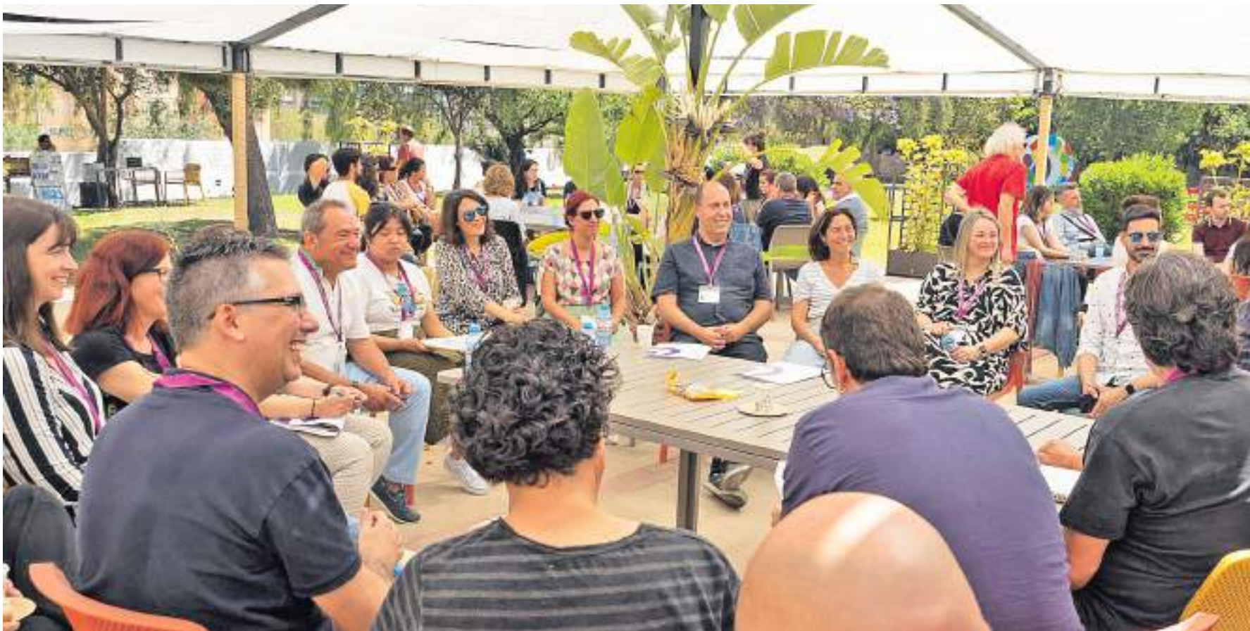
Presentación de resultados del Observatorio de Brechas Digitales con entidades de la Plataforma Red Conecta.