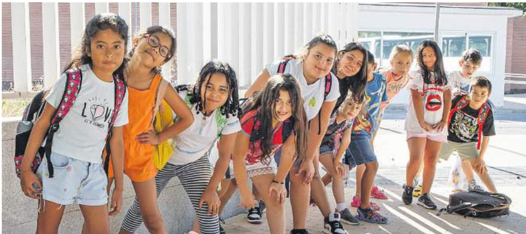
Campamento urbano Joven In Tech en el barrio de Latina, Madrid.

El código postal del lugar donde se vive determina las oportunidades a las que se tiene acceso y sitúa círculos de vulnerabilidad que estructuran la pobreza en determinados barrios y ante las que es fundamental y determinante actuar para crear en su lugar círculos virtuosos.