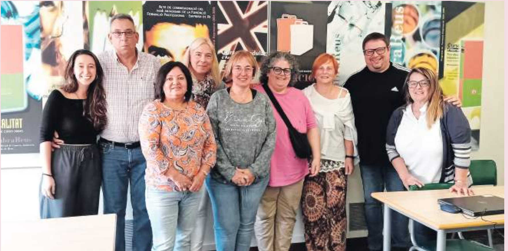
Grupo de participantes del curso en Barcelona del programa de capacitación digital +45